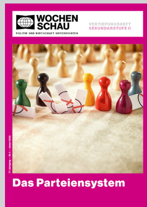
Sek. II, Januar 2026 Best.-Nr. 2126, 24 S., € 19,90