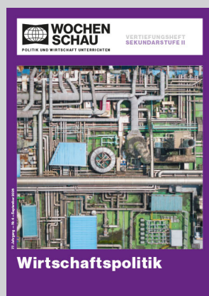
Sek. II, September 2026 Best.-Nr. 2426, 40 S., € 19,90