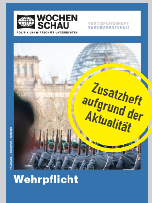
Sek. II, April 2026 Best.-Nr. 26e, 16 S., € 19,90