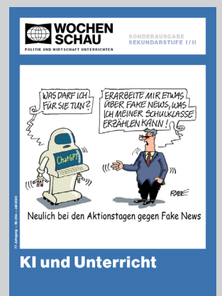
Sonderausg. Sek. I+II, Juli 2026 Best.-Nr. 26s, € 29,90