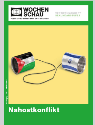
Sek. I, Oktober 2026 Best.-Nr. 1426, 24 S., € 19,90