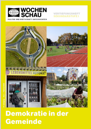
Sek. I, Februar 2026 Best.-Nr. 1126, 24 S., € 19,90