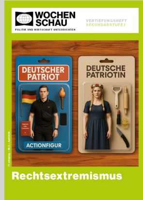
Sek. I, April 2026 Best.-Nr. 1226, 32 S., € 19,90