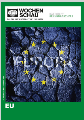
Sek. I, Dezember 2026 Best.-Nr. 1526, 40 S., € 19,90