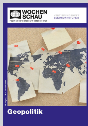
Sek. II, November 2026 Best.-Nr. 2526, 32 S., € 19,90