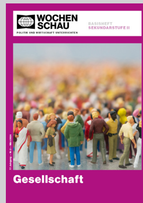
Sek. II, März 2026 Best.-Nr. 2226, 40 S., € 19,90