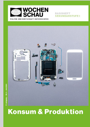
Sek. I, Juni 2026 Best.-Nr. 1326, 40 S., € 19,90