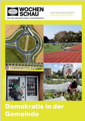
Sek. I, Februar 2026 Best.-Nr. 1126, 24 S., € 19,90