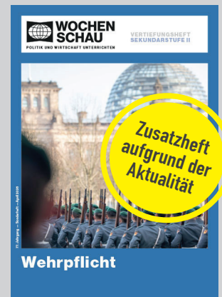
Sek. II, April 2026 Best.-Nr. 26e, 16 S., € 19,90