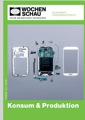
Sek. I, Juni 2026 Best.-Nr. 1326, 40 S., € 19,90