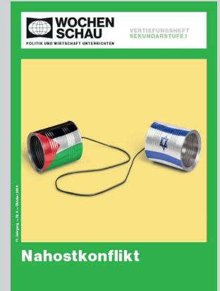
Sek. I, Oktober 2026 Best.-Nr. 1426, 24 S., € 19,90