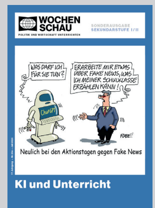
Sonderausg. Sek. I+II, Juli 2026 Best.-Nr. 26s, € 29,90