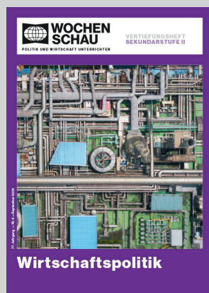
Sek. II, September 2026 Best.-Nr. 2426, 40 S., € 19,90