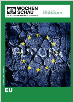
Sek. I, Dezember 2026 Best.-Nr. 1526, 40 S., € 19,90