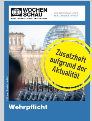
Sek. II, April 2026 Best.-Nr. 26e, 16 S., € 19,90