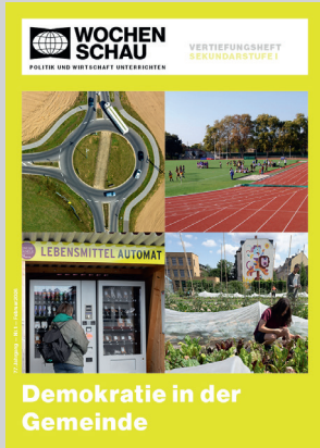
Sek. I, Februar 2026 Best.-Nr. 1126, 24 S., € 19,90