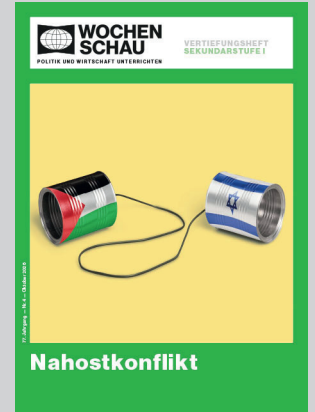
Sek. I, Oktober 2026 Best.-Nr. 1426, 24 S., € 19,90