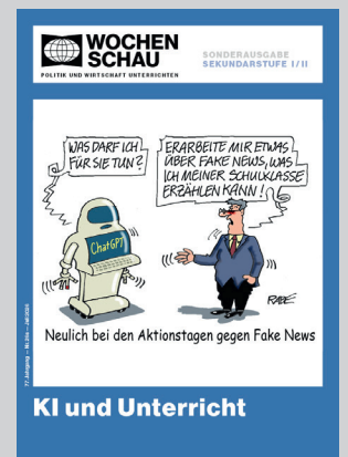
Sonderausg. Sek. I+II, Juli 2026 Best.-Nr. 26s, € 29,90