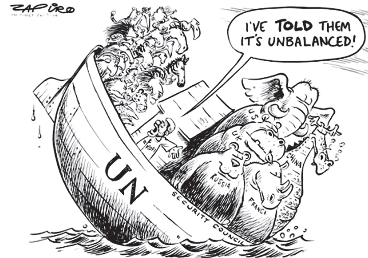
Karikatur von Zapiro, in: Sunday Times, 26.09.2004 ( www.zapiro.com/cartoon/126031-040926st [17.11.2011]).