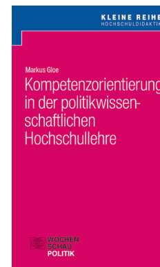
von Markus Gloe (LMU München)

ISBN 978-3-7344-0652-2, 56 S., € 9,90 PDF: ISBN 978-3-7344-0653-9, € 9,90