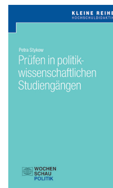
von Petra Stykow (LMU München)

ISBN 978-3-7344-0650-8, 56 S., € 9,90 PDF: ISBN 978-3-7344-0651-5, € 9,90